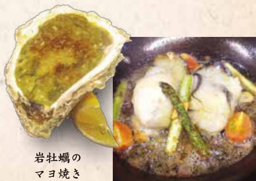
岩牡蠣の マヨ焼き